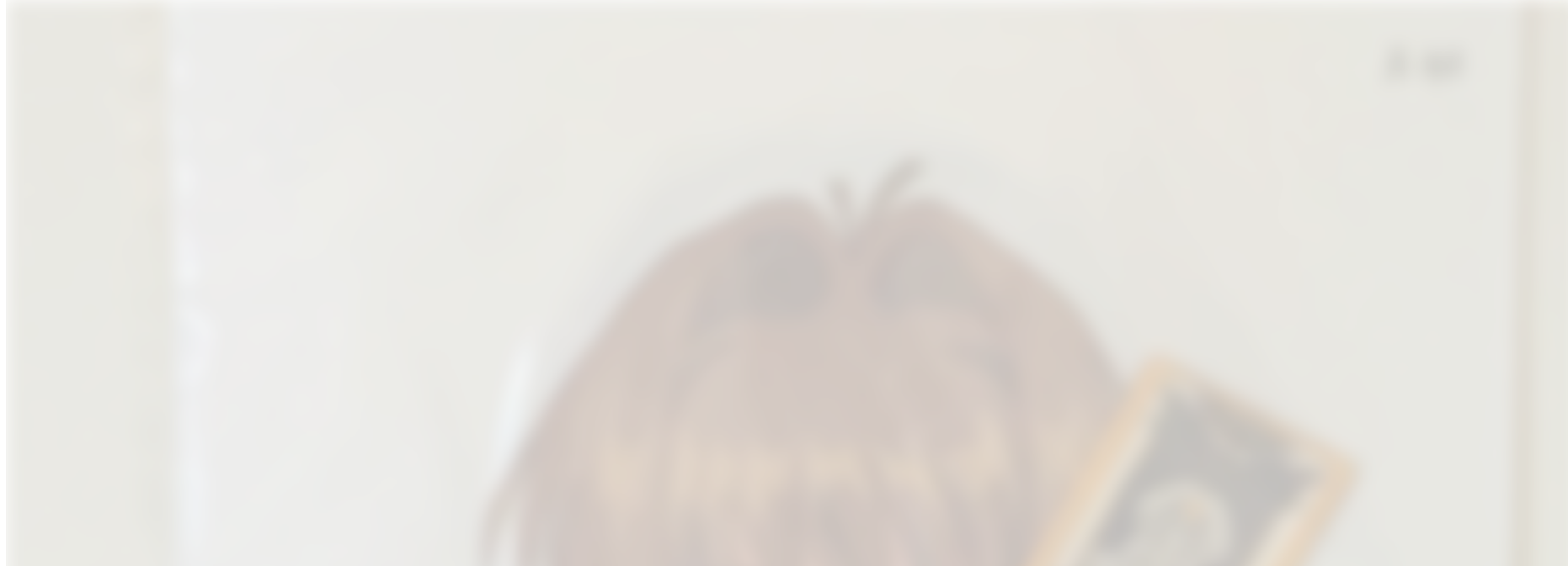
我收藏的百变小樱赛璐璐片

2. 中判赛璐璐片：在日拍上一般被称作中判，有的时候也会被叫大判，可以是b4尺寸左右。比一般的赛璐璐片/纸质原画大一截左右，有的时候是横着更长，有的时候是竖着更长。原画阶段一般是两张粘在一块让作画空间加倍。